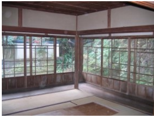
昔ながらの矩折りの廻り廊下

前回より始まった特集、「甦る家」の第二回目です。取材の日は寒い日でしたが、前日までの暖かな陽気のせい、近くの極楽寺では梅の花が咲いていました。