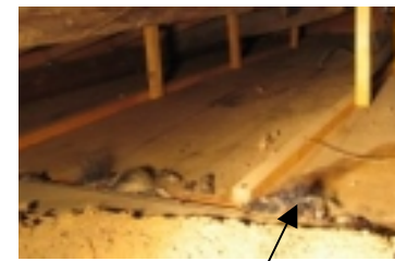
屋根裏のフンの山

ハクビシンは、漢字では「白鼻芯」と書くとおどろき、鼻から頭にかけたの白い毛が特徴です。一見可愛い姿をしていますが、外来種で、ときどき民家に入り込んで、食物を荒らすなどのいたづらを行います。