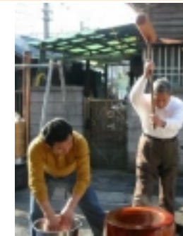
臼と杵は今年も健在です。みんなでついたお餅の味は最高でした！

《鎌倉マイホーム学院 第4期生募集中！》 3/1(土)開講 『基礎から学ぶ住まいづくり』 一緒に参加しませんか？