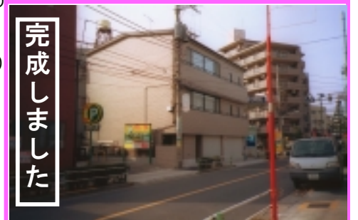
東京都板橋区 鉄骨3階建ビル 前年10月号では、骨組みだけの写真でしたが、きれいなビルに仕上がりました。

日向建設では、こうした『リフォーム』こそ、長く住み継ぐ家にしていくための適切な方法なのではないかと思っています。皆さんとともに、健康な住まいについて考えていきたいと思っています。ぜひ、ご相談ください。