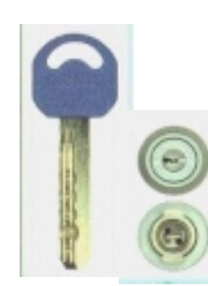
▲「ロイヤル★ガーディアン」というカギ。時間をかけてもピッキング不可能。新たな手口の開錠犯罪にも対応している。2002年度グッドデザイン賞を受賞した商品。