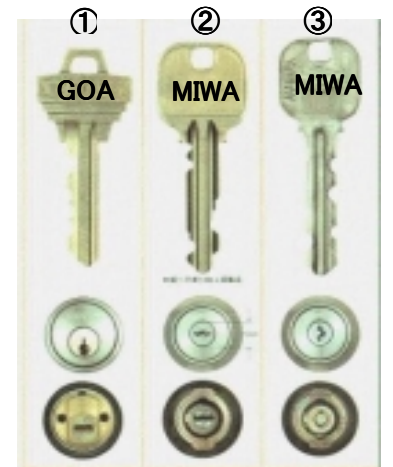
▲市場に多く出回っているタイプの鍵。構造的に、簡単に施錠することが可能であるため、1施錠では不安といわれる。

さて、ちょっと家のカギを手にとって見て下さい。右写真のカギは、現在、多くの住宅で使われているタイプですが、防犯の観点から言うと「危険なカギ」と言われます。