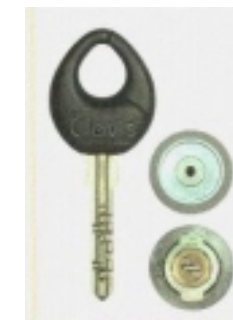
▲「クラビス-Q18」という種類のカギ。付属のIDカードを専門店に持参しないと、スペアキーを作れない。

日向建設では、大切な家の防犯対策の基本として、カギも重要と考えています。お気軽にご相談下さい。